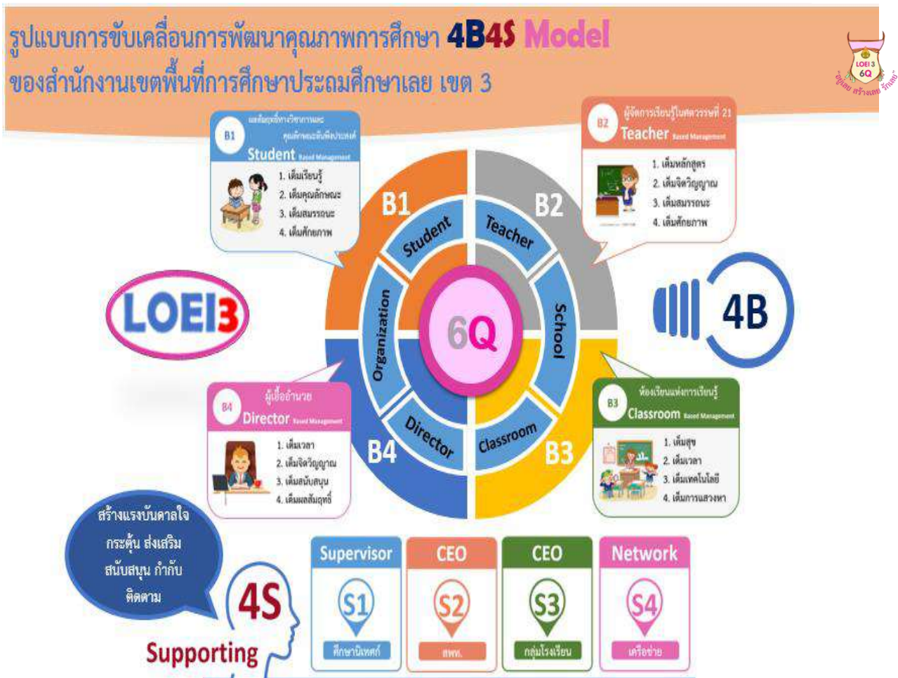
รูปแบบการขับเคลื่อนการพัฒนาคุณภาพการศึกษา 4B 4S Model